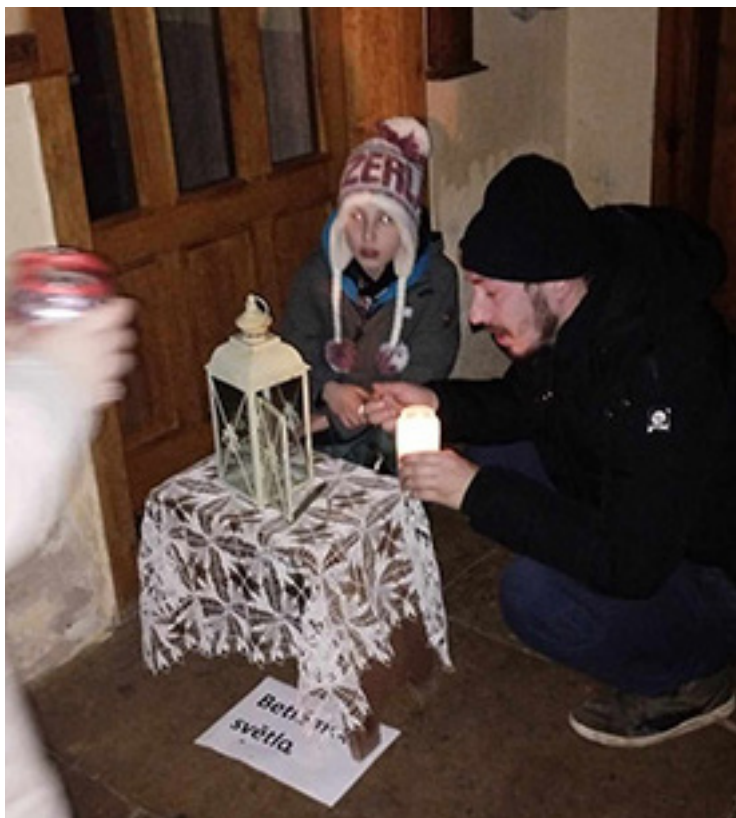
Matýsek s tatínkem